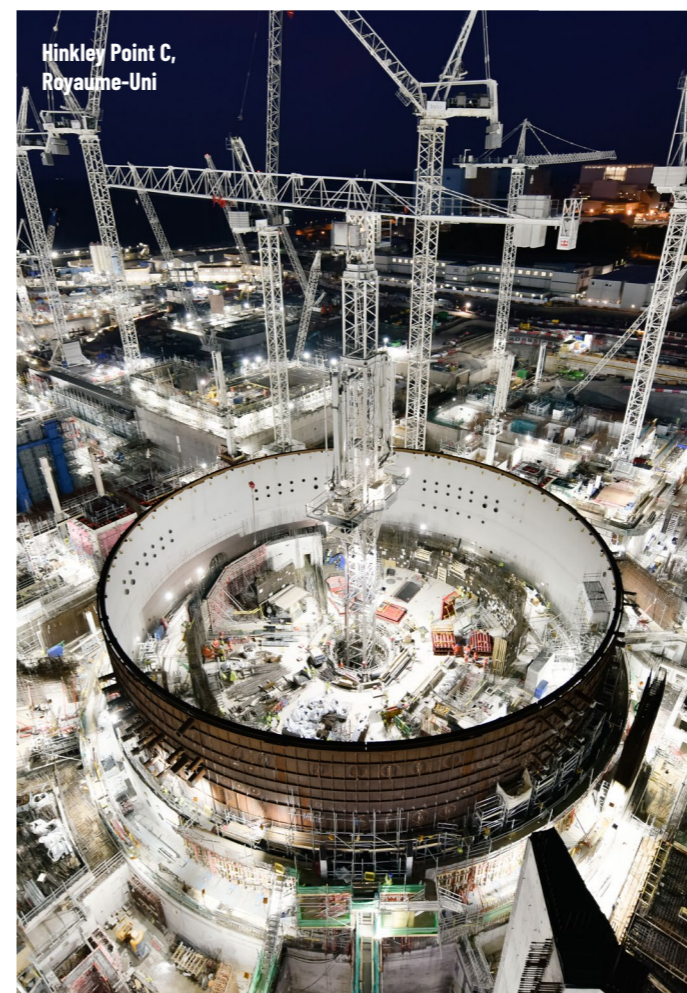
Hinkley Point C, Royaume-Uni