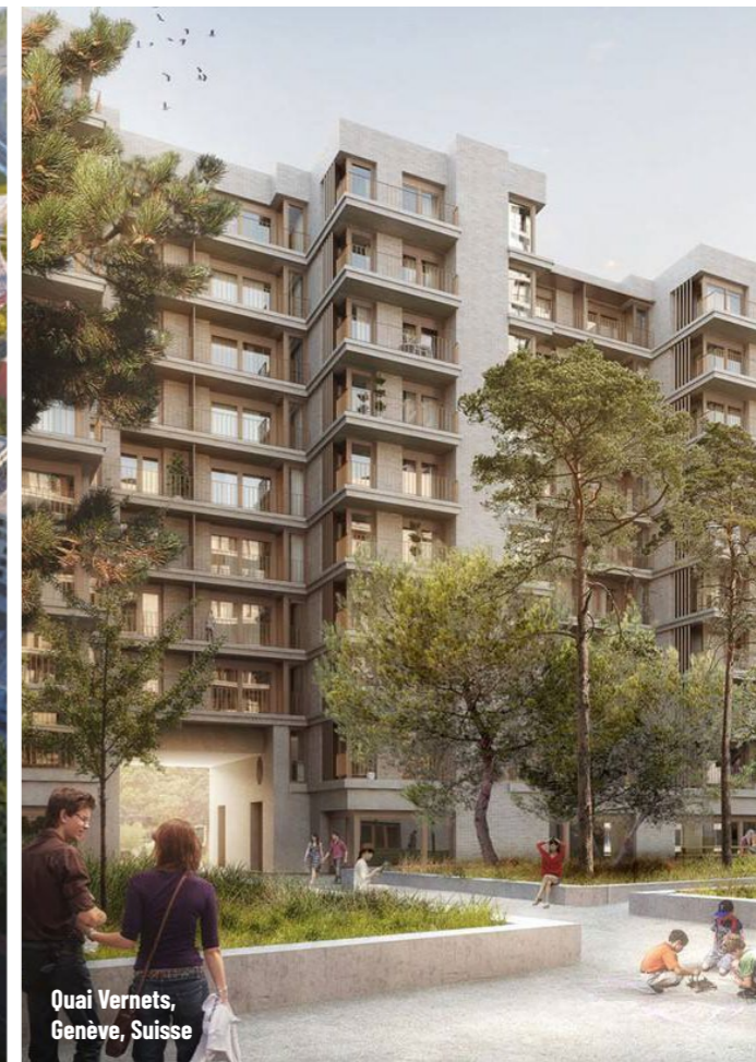
Quai Vernets, Genève, Suisse