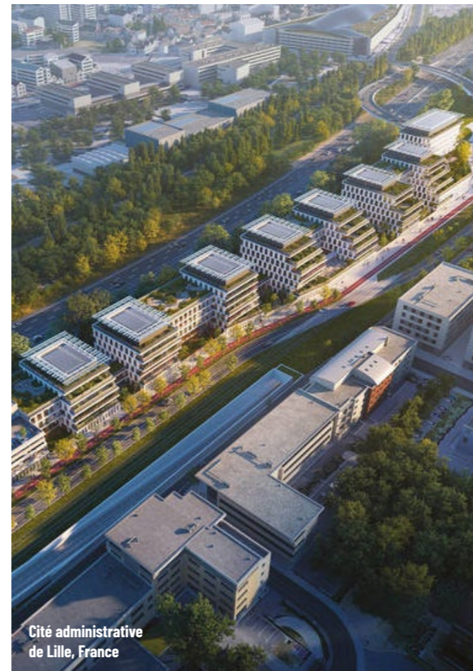
Cité administrative de Lille, France