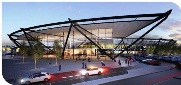
© Rogers, Stirk, Harbour + Partners

GFC Construction, filiale de Bouygues Construction pour le sud-est de la France, vient de signer avec Aéroports de Lyon un contrat de 142 millions d'euros pour la conception-construction du futur Terminal 1 de l'aéroport Lyon-Saint Exupéry. GFC Construction est mandataire du groupement constitué également des architectes RHSP et Chabanne et partenaires, Technip TPS, Cap Ingélec, Inddigo.